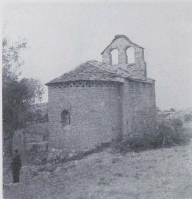
Fig. 240. - Exterior de Sant Romà d'Abella

L'absis és ornat d'un fris de figures molt esborrades sobre un sòcol ornamentat amb quadrats posats de punta. La finestra de l'absis presenta també policromia en la seva esqueixada i una representació de les