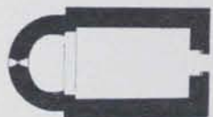
Fig. 238. - Pla de Sant Romà d'Abella (1:400)

Així és el pla de l'absis i les arcades que el precedeixen. El portal té les portes penjades, en la forma que es perpetua a l'arquitectura musulmana, en dos carreus sortints.